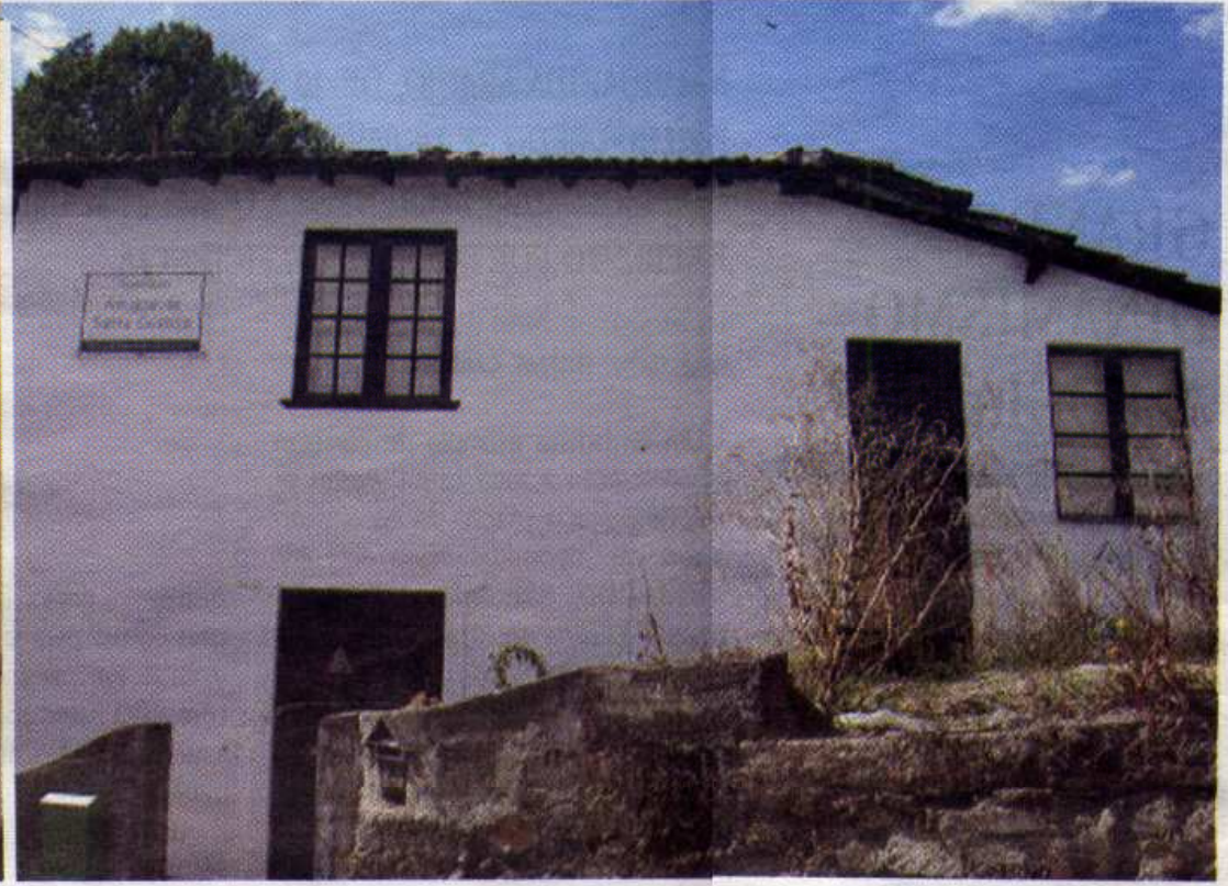
IMAGENS DA SEDE DA ASSOCIAÇÃO AMIGOS DE SANTA CRISTINA, GRUPO DE INTERVENÇÃO SOCIAL E CÍVICA